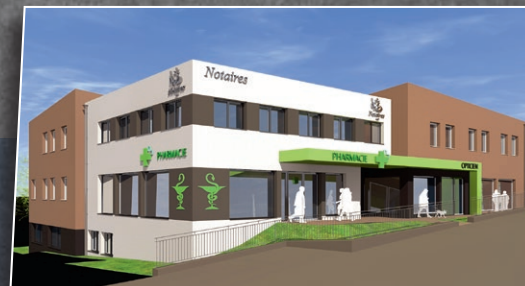
D'installations médicales et paramédicales