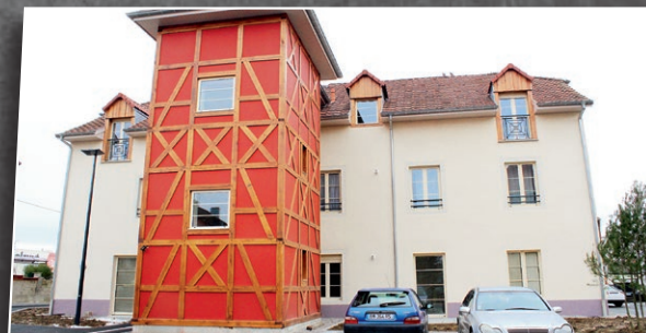
D'un habitat en pleine évolution