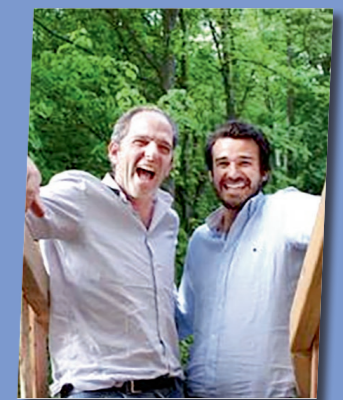
Cabanes des Grands Reflets

« Nous avons été séduits par le patrimoine écologique et naturel du Sud Territoire et impressionnés par la volonté de ses élus d'y développer le tourisme et ses structures d'accueil. C'est avec plaisir que nous avons implanté notre éco-village de 19 cabanes perchées