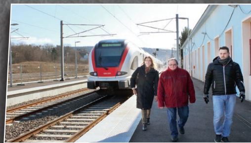
D'un accès ferroviaire Suisse/TGV