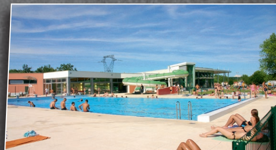
D'équipements de loisirs et sportifs de haut niveau