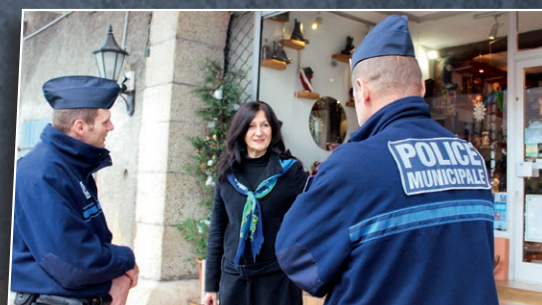
D'une police intercommunale de proximité