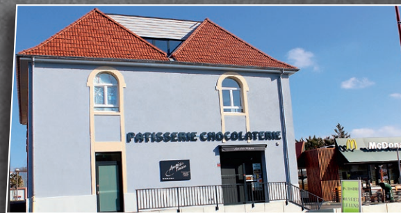
De commerces de proximité